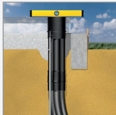
Abb. 9: Ausrichtung Quadro-Secura® Nova BP-R